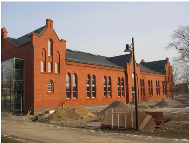
Gebäudeansicht vom Campus

Das zuletzt von den russischen Truppen als Casino genutzte Gebäude ist zum Hörsaal auszubauen. Dabei sind die denkmalschützerischen Belange sowohl in Hinblick auf die Wahrung der ursprünglichen Fassadenansicht sowie die innere Gebäudestruktur der ehemaligen Reithalle der preußischen Kavallerie zu berücksichtigen und in Einklang mit den Anforderungen an die technische Ausrüstung eines modernen Hörsaals zu bringen.